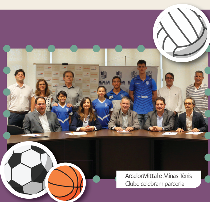
ArcelorMittal e Minas Tênis Clube celebram parceria

Em 2019, foram 23 projetos executados, beneficiando cerca de 190 mil pessoas direta e indiretamente, 63% a mais do que no ano anterior.